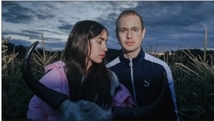
TIL TROMSØ: Highasakite tar turen til The Edge i mars neste år.